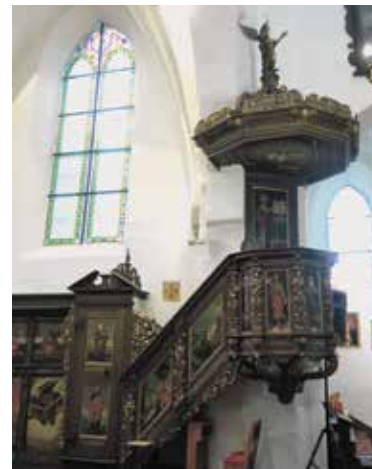
Pruszcz Gdański. Wnętrze kościoła, późnorenesansowa ambona z 1578 r.

Za to pozostawiono późnorenesansową ambonę z 1578 r. dekorowaną manierystycznymi ornamentami chrząstkowo-małżowinowymi oraz główkami aniołków, zwieńczoną rzeźbą anioła. Na balustradzie korpusu ambony znaj-