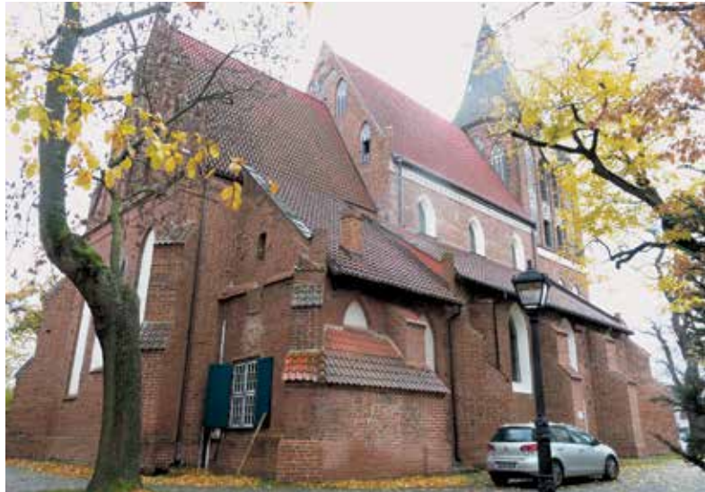
Pruszcz Gdański. Kościół pw. Podwyższenia Krzyża Świętego. Widok na prezbiterium od strony północno-wschodniej.

Na pograniczu Wyżyny Gdańskiej i terenów nizinnych zwanych Żuławami, na południe od Gdańska, nad Radunią leży ponad 30-tysięczny Pruszcz Gdański, miasto wchodzące w skład aglomeracji trójmiejskiej. Na obszarze Pruszcza Gdańskiego odnaleziono ślady osadnictwa z VIII w. p.n.e. (wczesna epoka żelaza). Archeolodzy właśnie tu odkryli najstarszą fajkę na terenie Polski, najprawdopodobniej fenicką, mającą jakieś 2,5 tysiąca lat.