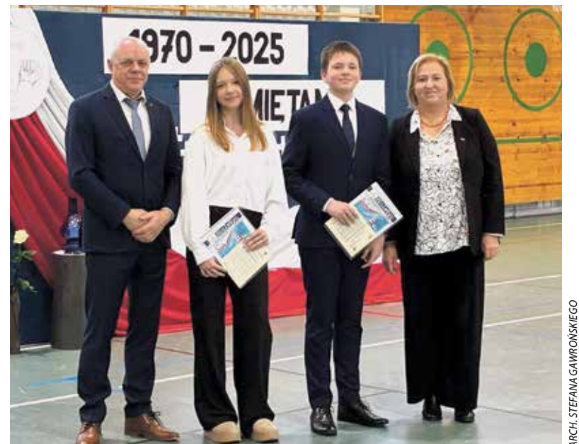
ARCH. STEFANA GAWROŃSKIEGO

Nauczyciele i uczniowie Szkoły Podstawowej im. Bohaterów Grudnia '70 w Łęgowie – jak przystało na noszącą wyjątkową nazwę placówkę edukacyjną – 15 grudnia 2025 r. zorganizowali rocznicową akademię.