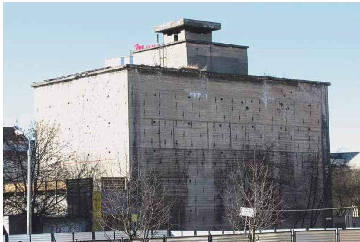
Gdańsk, ul. Olejarna. Schron przeciwlotniczy, dziś klub.

Historia jest nauczycielką życia? W rozporządzeniu ministra spraw wewnętrznych z 26 sierpnia 1939 roku przewidywano, że na działce zabudowanej budynkami mieszkalnymi o kubaturze ponad 2,5 tysiąca metrów sześciennych powinny zostać urządzone schrony przeciwlotnicze – stało się to co najmniej o dekadę za późno jak wiemy.