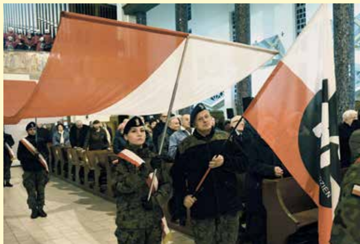
FOT. ARTUR GORSKI