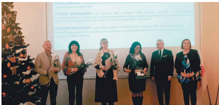
Laureaci złotych i srebrnych odznak KSOiW, grudzień 2023 r.