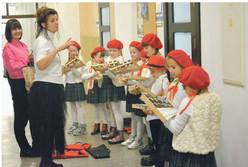
Przed występem na konkursie „Polska – moje miejsce, mój kraj”.

Organizacją konkursu zajmuje się Prezydium Międzyregionalnej Sekcji Oświaty i Wychowania NSZZ „Solidarność” zs. w Gdańsku.