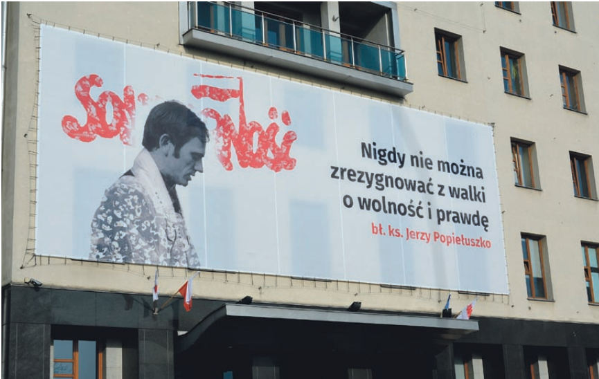
Baner na budynku „Solidarności” w Gdańsku.

dwa miesiące przed zamordowaniem Księdza przez służby specjalne PRL. Padają w niej słowa: Przebacząc, dajemy szansę temu, komu przebaczymy. Dajemy mu szansę również wkroczenia na drogę miłości. W Modlitwie Wiernych modlił się, aby Ojczyzna rozwijała się w sprawiedliwości, miłości i prawdziwej wolności.