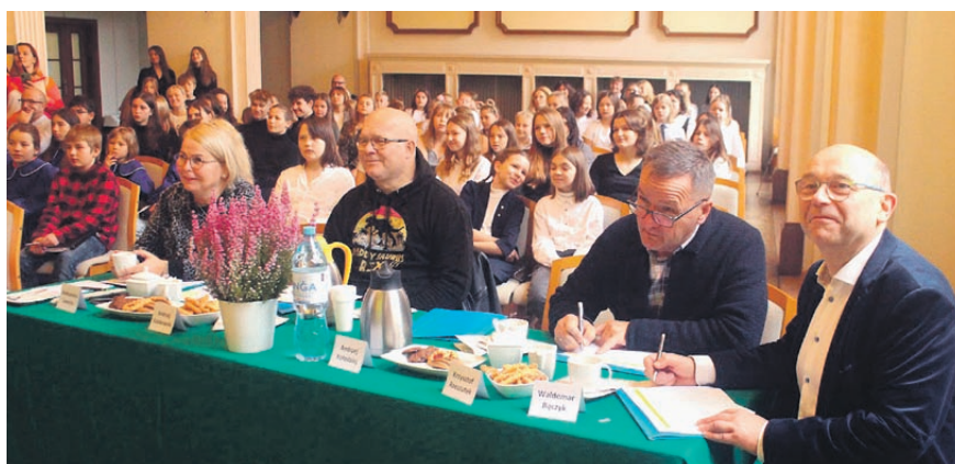
Jury 7 edycji Konkursu Muzycznego.