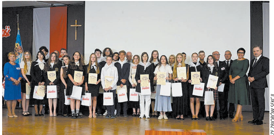
Stypendyści, zaproszeni goście i Kapituła Funduszu Stypendialnego w Sali BHP, 2023 r.

w Łęgowie, w Bielkówk , w Przywidzu, w Żukowie, w Cedrach Wielkich, w Rotman , w Straszynie; Gimnazjum nr 2, LO nr I, nr II; Zespół Szkół Ogrodniczych i Ogólnokształcących – w Pruszczu Gd.