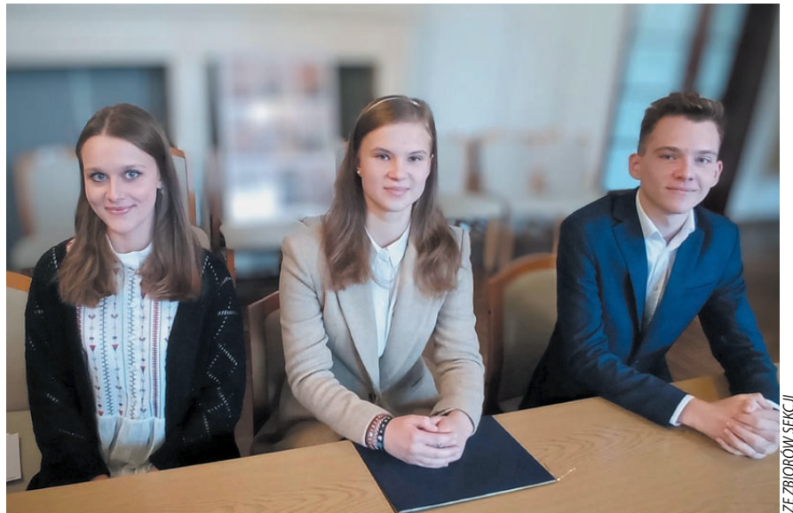
Stypendyści Funduszu Stypendialnego NSZZ „Solidarność”, 2023 r.

Powiat gdański: SP – w Cedrach Małych, w Cedrach Wielkich, SP i Gimnazjum