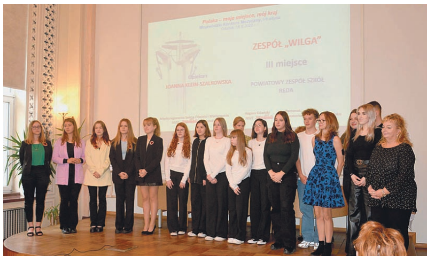
Zespół „Wilga” – laureaci VII edycji konkursu „Polska – moje miejsce, mój kraj”