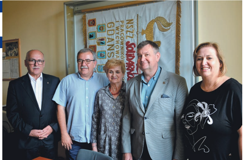
Robocze spotkanie z władzami KSOiW, czerwiec 2023 r.