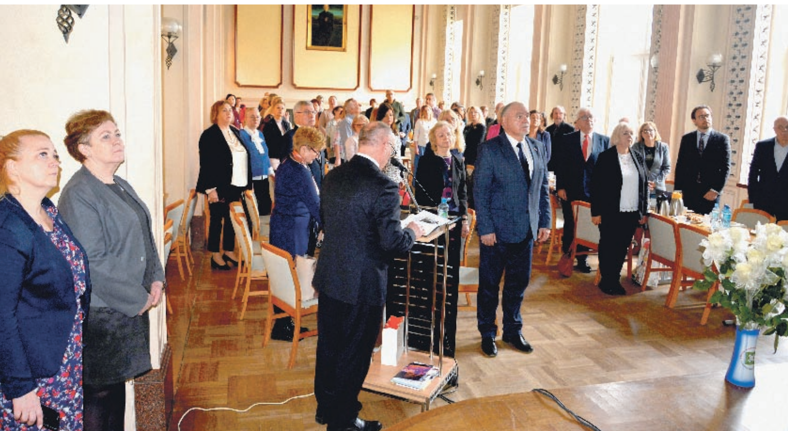
WZD Sekcji – 18.04.2023 r.