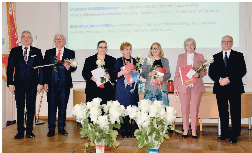
WZD Sekcji – wręczenie Złotych Odznak KSOIW.