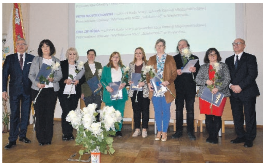
WZD Sekcji – wręczenie Srebrnych Odznak KSOIW.

Obok przedstawiamy fragmenty dokumentów programowych. Całość została zamieszczona na stronie internetowej Sekcji.