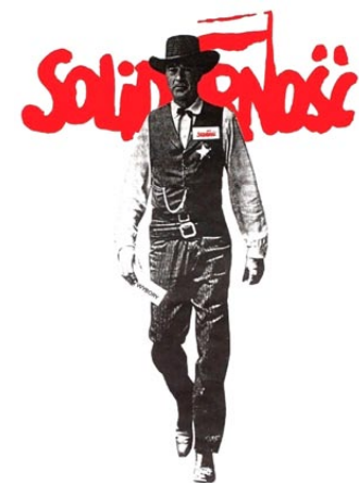
W SAMO POŁUDNIE

Bez wsparcia odradzającego się NSZZ „Solidarność” włąła opozycja nie mogłaby skutecznie stanąć w wyborcze szranki. 18 grudnia ogłoszono powołanie Komitetu Obywatelskiego. Kandydatów KO wspierali artyści o międzynarodowej sławie, a symbolem wyborów był plakat nawiązujący do filmu