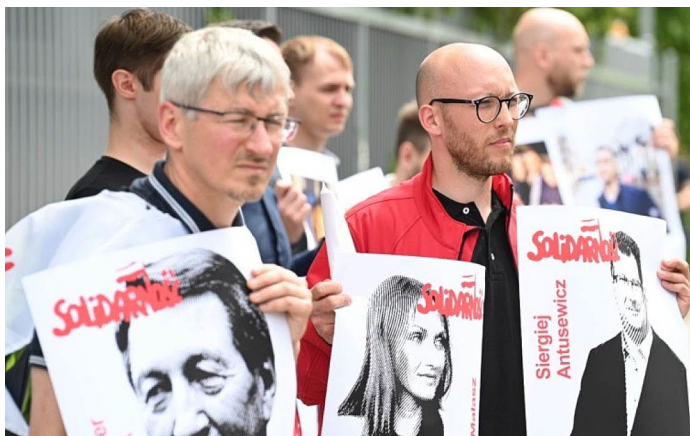
Protest, jaki odbył się w sprawie uwięzionych.