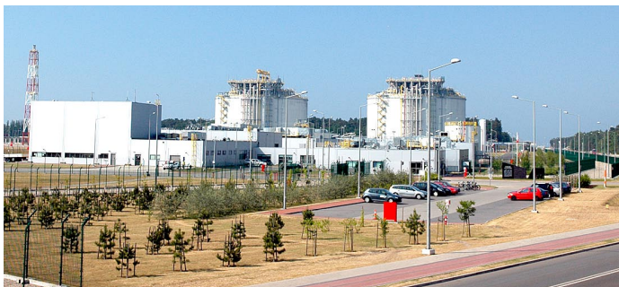
JAROSŁAW DROZDZEWSKI / WIKIMEDIA COMMONS

Terminal LNG im. Prezydenta Lecha Kaczyńskiego w Świnoujściu.