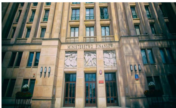
Ministerstwo Finansów (fot.gov.pl)

Mamy prawo do odliczenia od dochodu do 300 zł rocznie z tytułu opłaconych składek związkowych – po raz pierwszy w zeznaniu PIT za 2022 r., składanym w 2023 r. Związkowiec z pierwszego progu podatkowego (17 proc.) może zmniejszyć podatek o raptem 51 zł. Dla płatników z II progu – odpis od podatku będzie wyższy. W naszym systemie zaangażowanie związków zawodowych na rzecz poprawy warunków pracy skutkuje dla wszystkich pracowników i przyczynia się do budowania społeczeństwa obywatelskiego. Związki zawodowe mają wyłączne uprawnienie do negocjowania układów zbiorowych pracy oraz do prowadzenia sporów zbiorowych. Upowszechnienie członkostwa w związkach zawodowych osób wykonujących pracę zarobkową ma wymierną wartość. Aby działalność związków zawodowych przynosiła pracującym wymierne korzyści potrzebni są zaangażowani ludzie i stabilne podstawy finansowania działalności.