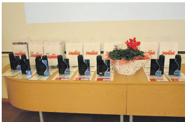
Nagrody Wojewódzkiego Konkursu Muzyczno-Plastycznego.