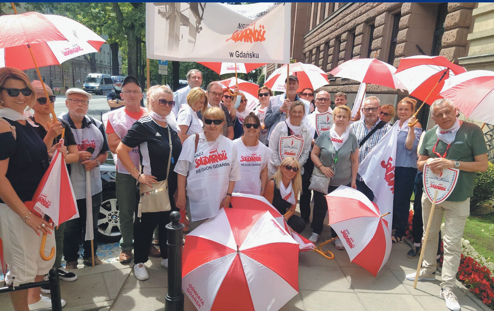
1 lipca 2021 r. – pikietą oświatowej „Solidarność” przed siedzibą Ministerstwa Edukacji i Nauki w Warszawie.