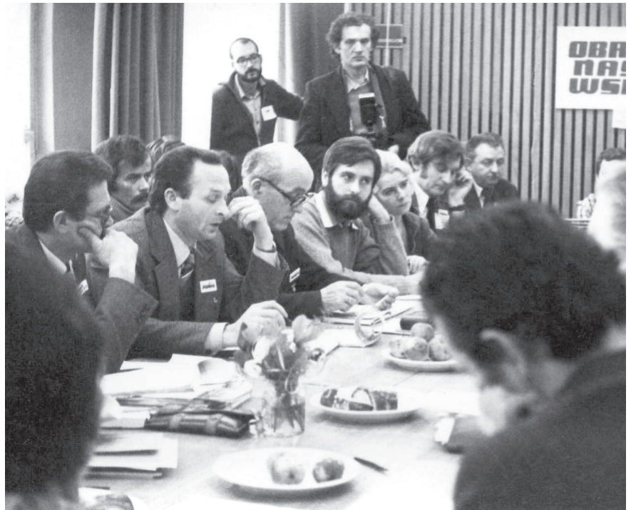
Członkowie Komitetu Strajkowego z listopada 1980 r. w trakcie negocjacji w Urzędzie Wojewódzkim w Gdańsku.

Całość artykułu, w tym część bardziej humorystyczna, jak przypomnienie reakcji bohatera „Dnia Świra” w chwili odbierania pensji, znajduje się na stronie: www.wojciechksiazek.wordpress.com (teksty edukacyjne).