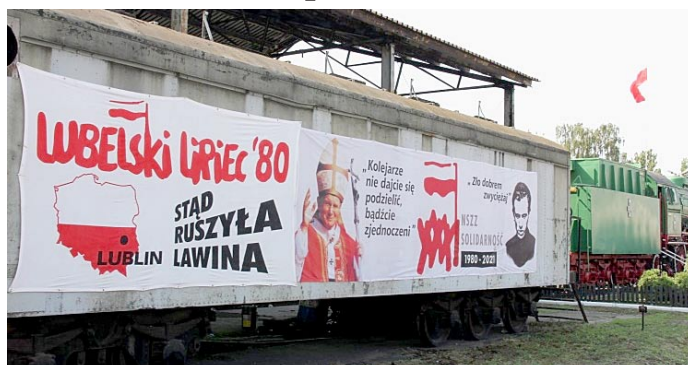
Plakaty w Starej Lokomotywowni w Lublinie.

W 1980 r. pierwszy raz w PRL nie odbyły się lubelskie obchody rocznicy ogłoszenia Manifestu PKWN, święta państwowego 22 lipca. Kryzys gospodarczy wkroczył w decydującą fazę, rodacy otrzęsali się ze złudnej „małej stabilizacji”. Władza po raz pierwszy została zmuszona do podpisania porozumień ze strajkującymi. Bezpośrednią przyczyną fali strajkowej latem 1980 r. była podwyżka cen artykułów mięsnych i wędliniarskich w bufetach zakładów pracy od 1 lipca 1980 r. 8 lipca