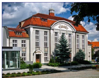
Budynek dawnego Domu Katolickiego, obecnie filharmonia zielonogórska.

Z chwilą rozpędzenia grupy przed budynkiem, na wieżę kościoła p.w. Matki Bożej Częstochowskiej dostało się kilka osób