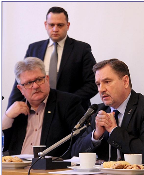
Na zdjęciu liderzy „S” i nowy naczelny „Tygodnika Solidarność”.

Podczas obrad wybrano nowego redaktora naczelnego Ty-